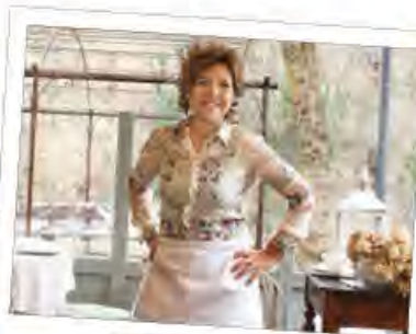
мероприятие 2: ужин в “Casa intoria”