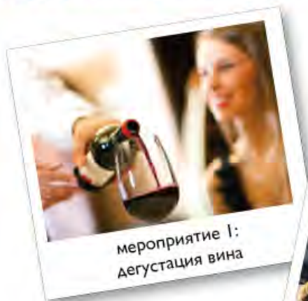
мероприятие 1: дегустация вина