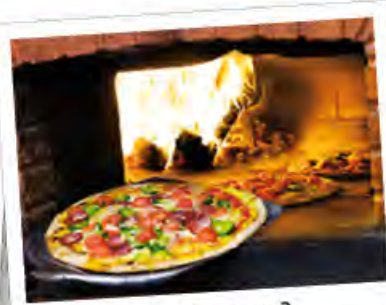
мероприятие 3: урок пиццы