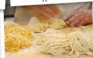
мероприятие 5: урок домашней пасты