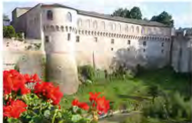
Урбания, «Замок Наслаждений» герцогов Ди Урбино