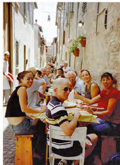
Главная площадь г.Урбания