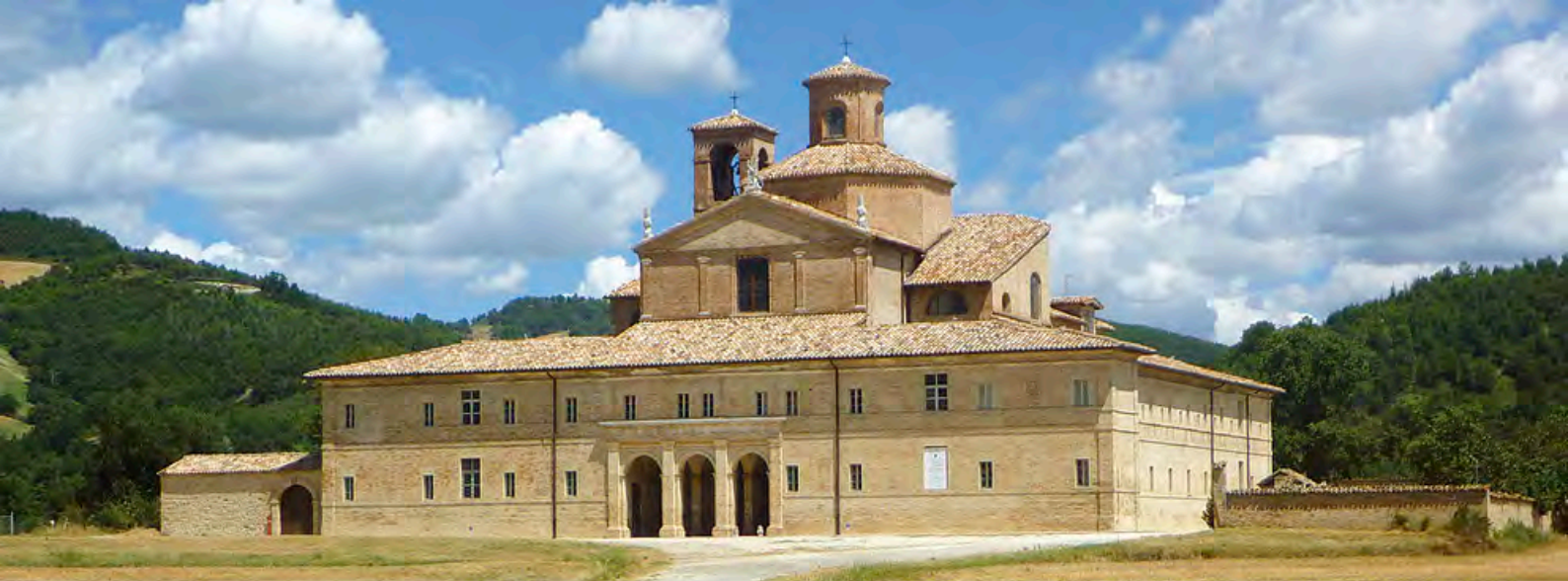
г.Урбания, «Корабль» (il "Varco"), охотничья усадьба Герцогов Ду Урбино (XV-XVIII век).